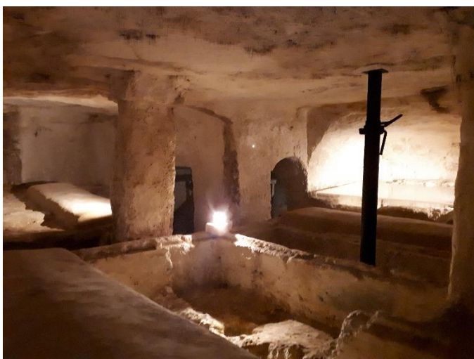
Rabat, Szt. Pál katakombák