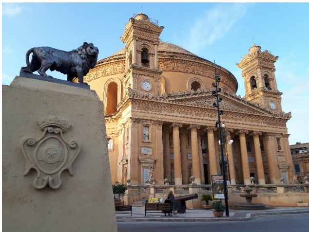
Mosta dómja a világ 3. legnagyobb kupolájával