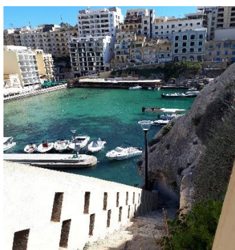
és a Xlendi-öböl