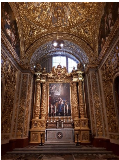
Szt. János Társkatedrális belseje