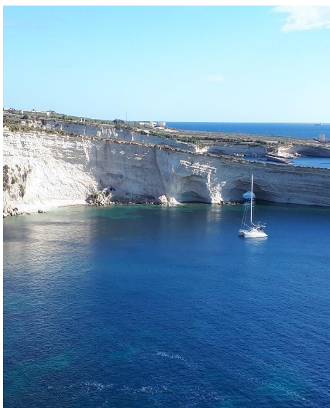
A sziget partjainál